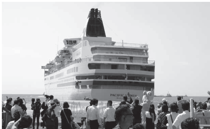
6月19日に寄港した、客船「ばしふいっくびいなす」