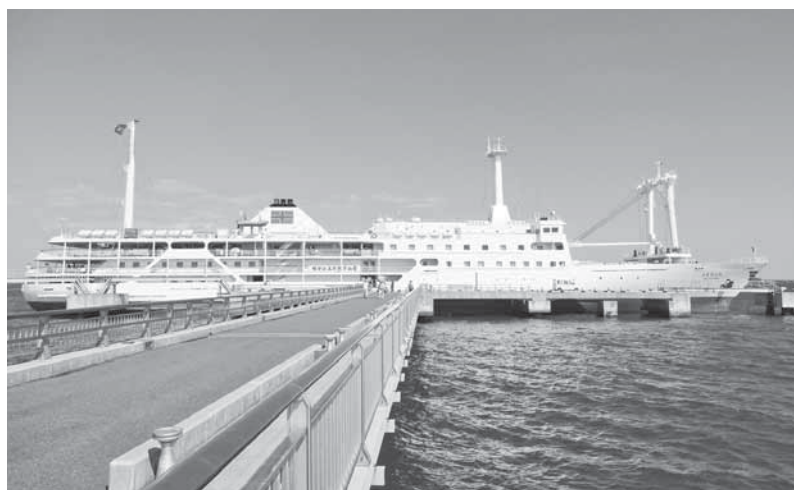
客船「さるび丸」チャーター寄港