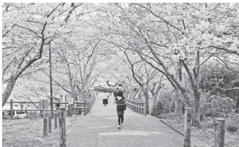
城山公園 4月2日撮影