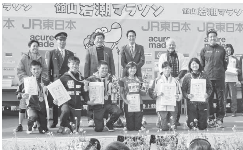
第36回館山若潮マラソン大会