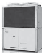
電源自立型空調GHP「エクセルプラス」