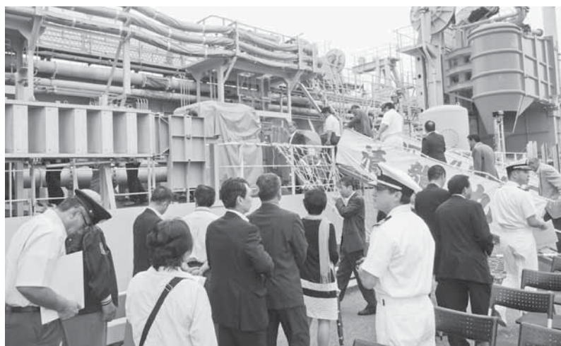
浚渫兼油回収船「清龍丸」寄港歓迎式典