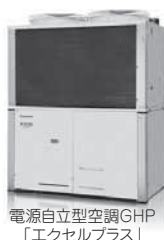
電源自立型空調GHP「エクセルプラス」

ガスエンジンを使って冷暖房を行うGHPは電気エアコンと比べて消費電力を大幅にカット