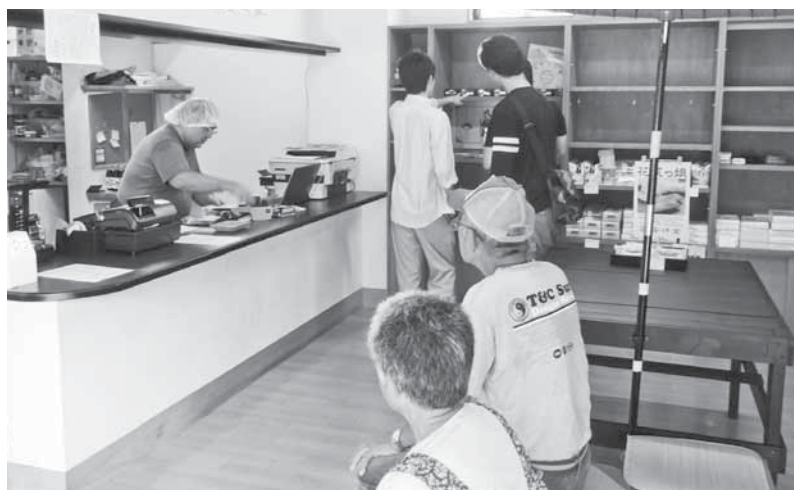
お茶とだんごの店 里見茶屋