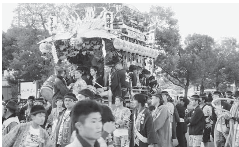
第33回 南総里見まつり