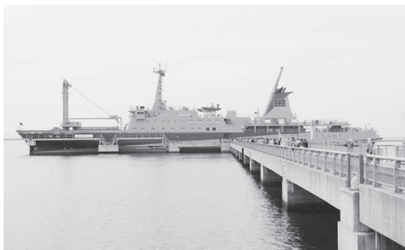
スーパーエコシップ「橘丸」寄港式典