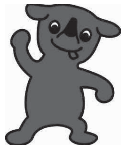
千葉県マスコットキャラクター「チーバくん」