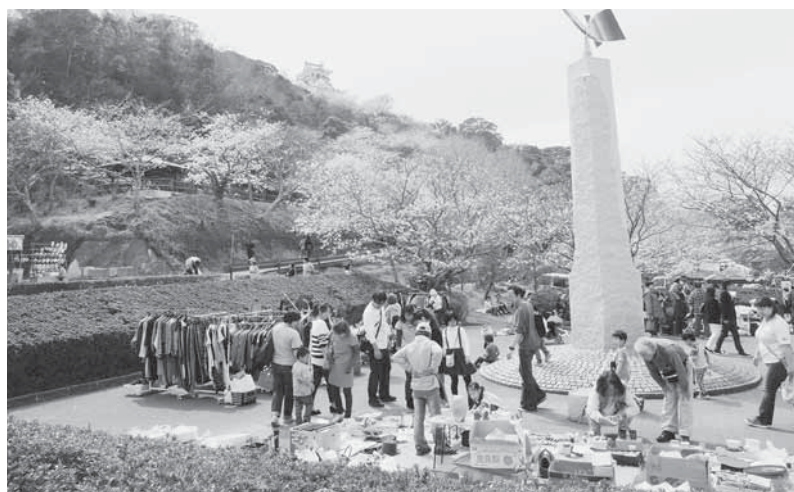
里見桜まつり (平成26年3月29日開催)