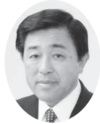
館山市長 金丸謙一