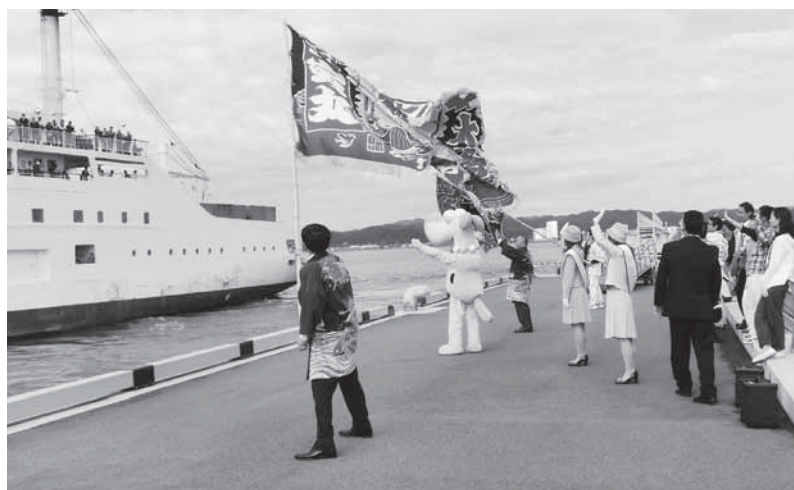
10月24日館山港多目的棧橋に寄港した『おがさわら丸』