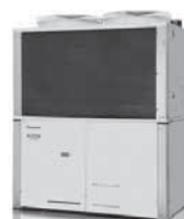
電源自立型空調GHP 「エクスプレス」