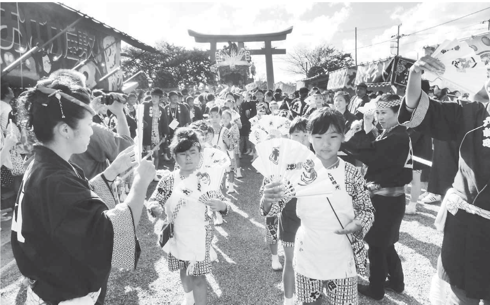
千葉県指定無形民俗文化財『やわたんまち』

●昭和51年7月10日 第3種郵便物認可 ●平成24年10月10日発行(毎月1回10日発行) 第538号 ●発行所/館山商工会議所 ●編集発行責任者/専務理事 山本佳幸 ●〒294-0047 千葉県館山市八幡 821 ●TEL0470-22-8330 FAX0470-23-4011 ●印刷所/株式会社 集賢舎 ●定価 1部20円(購読料は会費に含まれています)