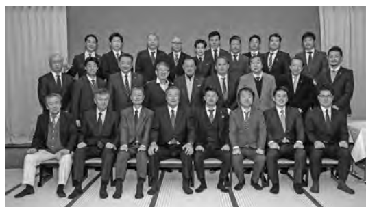
館山商工会議所青年部 1月定期総会

令和8年1月21日に1月定期総会が開催され、上程された議案は全て満場一致で賛成承認されました。