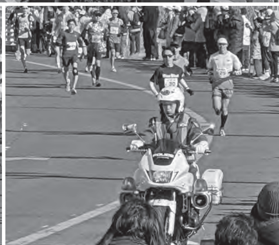
第46回館山若潮マラソン大会が開催されました。（1月25日）