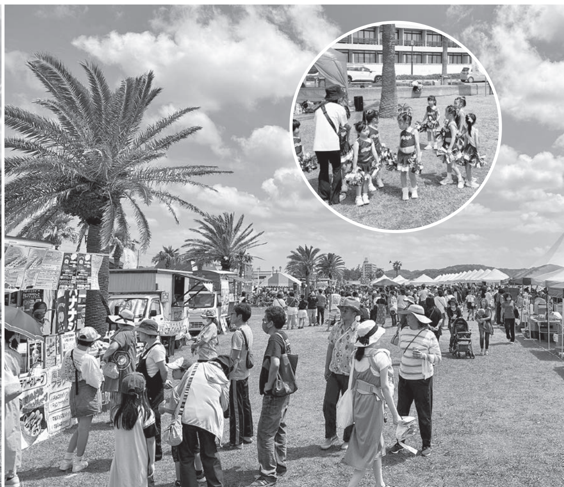
▲北条海岸BEACHマーケットの様子。(6月4日撮影)