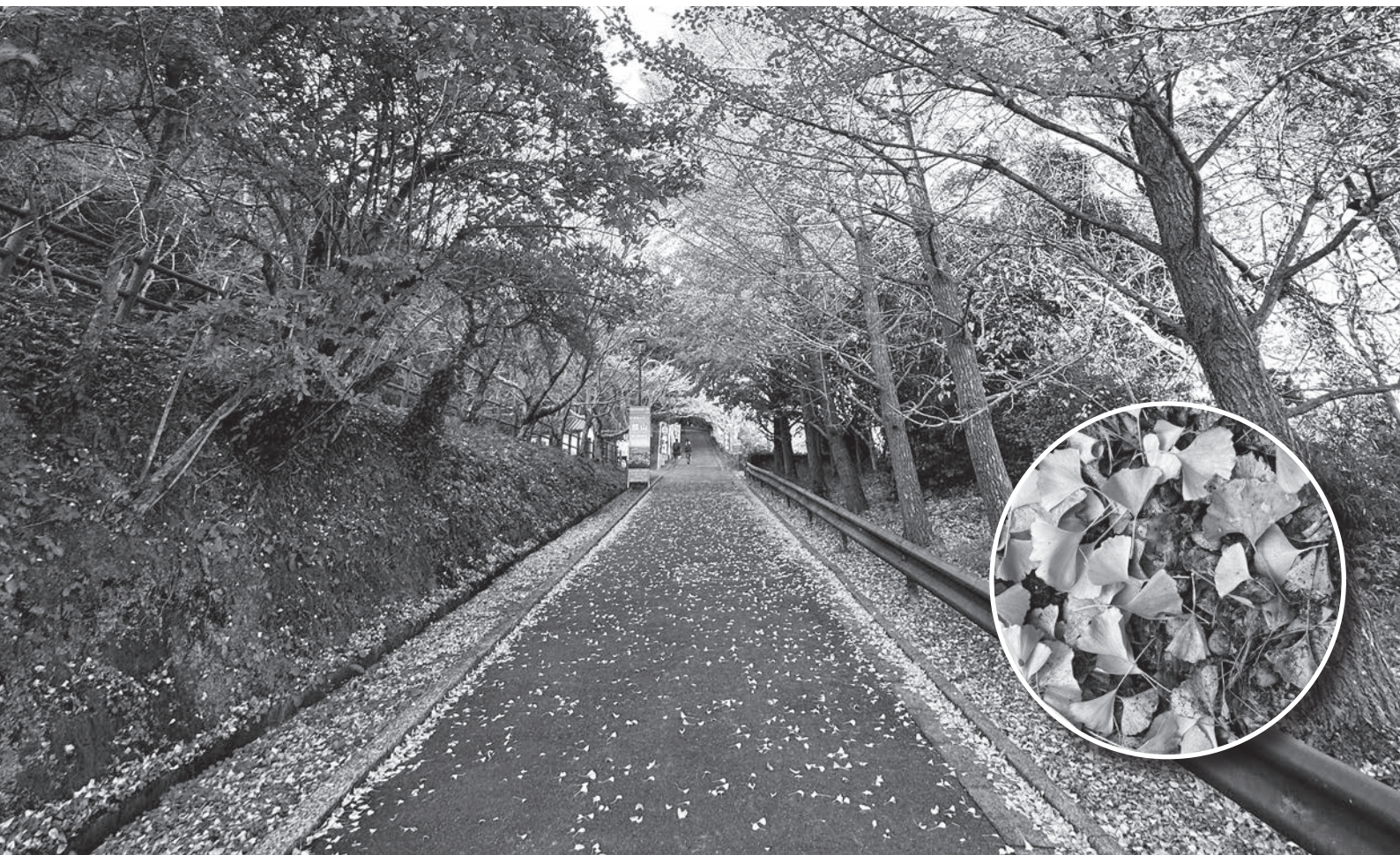
▲落ち葉が広がる城山公園 (11月19日撮影)

●昭和51年7月10日第3種郵便物認可●令和4年12月10日発行(毎月1回10日発行)第659号●発行所/館山商工会議所●編集発行責任者/専務理事 上野 宇●〒294-0047 千葉県館山市八幡 621 ●TEL0470-22-8330 FAX0470-23-4011 ●印刷所/株式会社 集賢舎●定価 1部 20円(購読料は会費に含まれています)