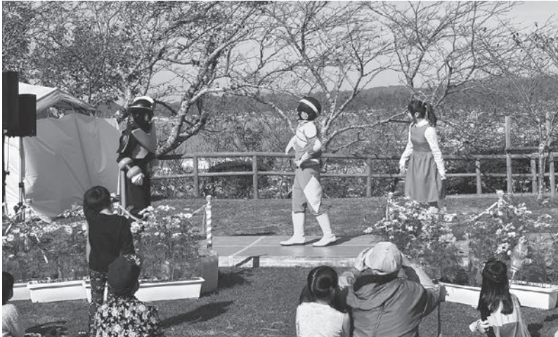
▲館山城開館40周年記念式典の様子(10月30日撮影)