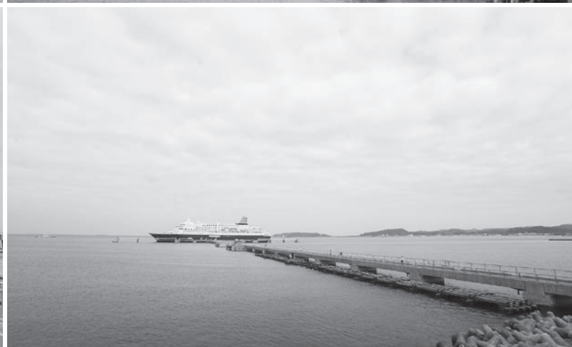
▲にっぽん丸寄港 (9月15日撮影)