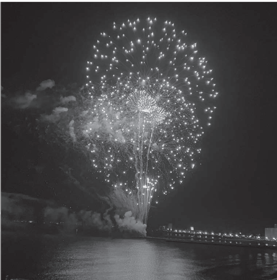
サプライズ花火(11月3日)