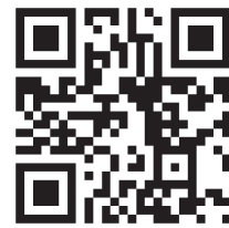
館山YEGの YouTubeチャンネル

お待ちせいたしました！館山YEG（商工会議所青年部）チャンネル第2回目をご案内いたします！ 今回は第1回目に引き続き、あの「伝説のOB」をお迎えして近年実際に館山YEGが行った事業をご紹介します！ 少しでも館山YEGの活動について知っていただければ幸いです！ 今後の配信も、お・み・の・が・し・な・い・よ・う・にー！