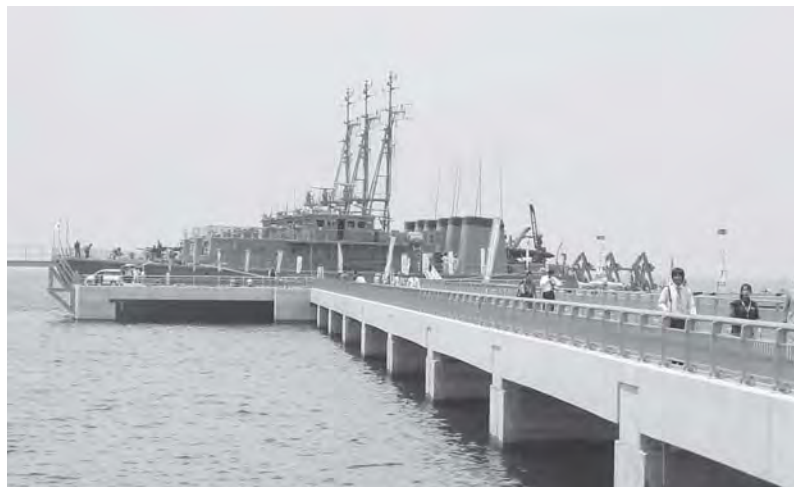
海上自衛隊「掃海艇」3隻が、多目的観光栈橋に初寄港