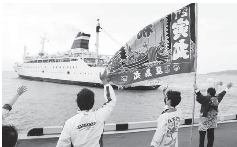
10月18日 館山港多目的観光棧橋に寄港した「おがさわら丸」