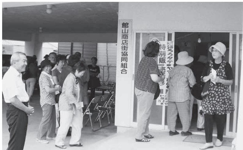
市内各所で、頑張ろうタテヤマ! 商品券発売