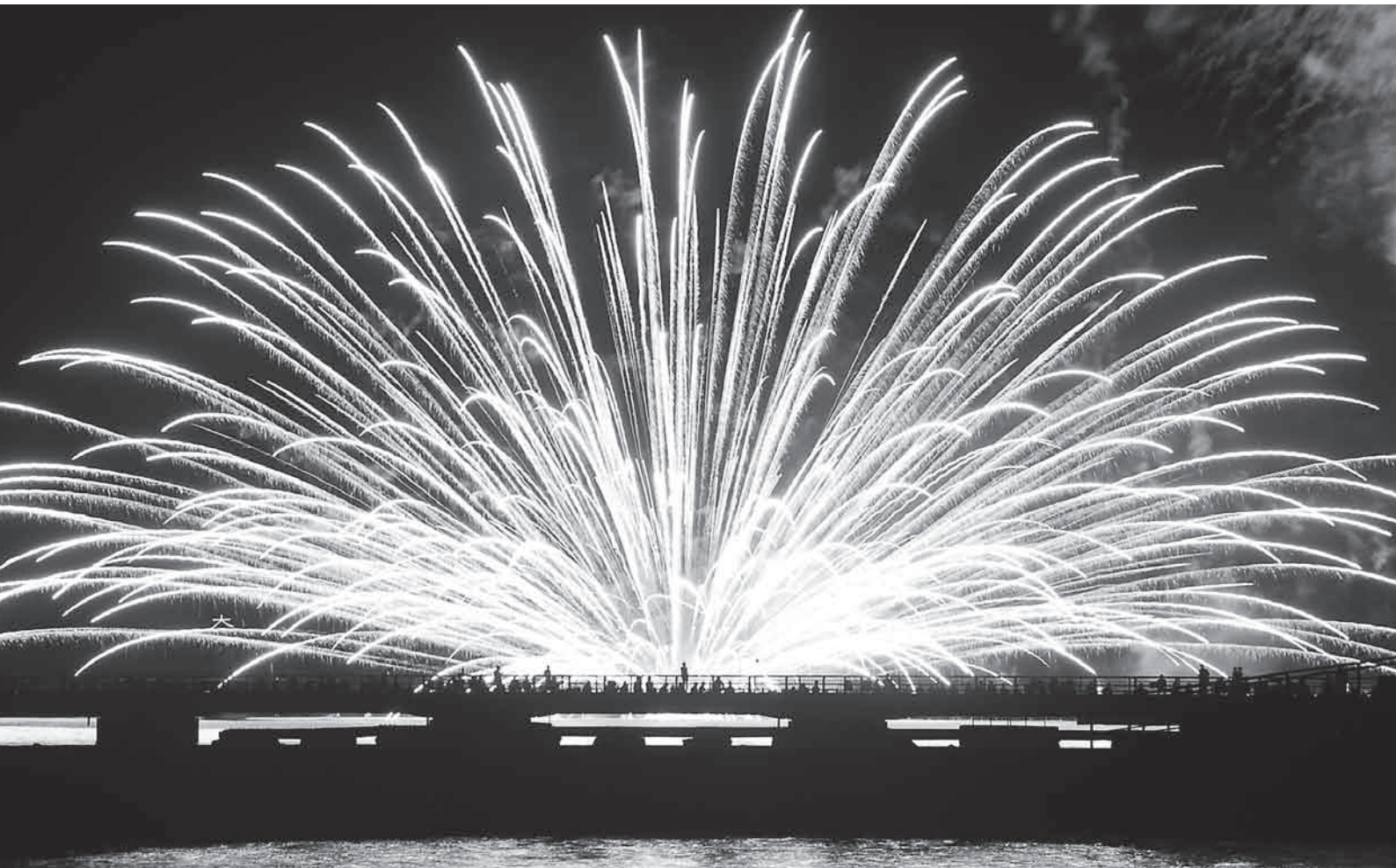
第48回館山観光まつり館山湾花火大会

●昭和51年7月10日 第3種郵便物認可 ●平成23年8月10日発行(毎月1回10日発行) 第524号 ●発行所/館山商工会議所 ●編集発行責任者/専務理事 山本佳幸 ●〒294-0047 千葉県館山市八幡 821 ●TEL0470-22-8330 FAX0470-23-4011 ●印刷所/株式会社 集賢舎 ●定価 1部 20円(購読料は会費に含まれています)