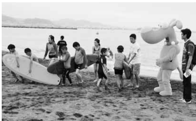
オーシャンフェスタ館山