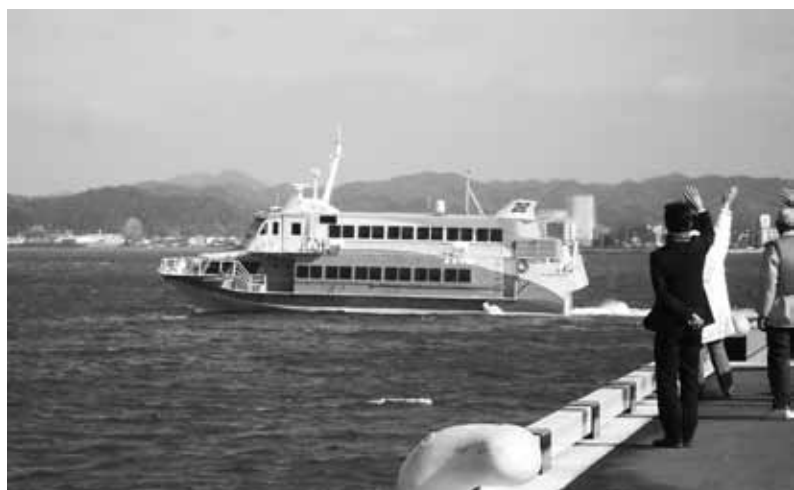
多目的観光桟橋を拠点に季節運航する高速ジェット船『セブンアイランド』