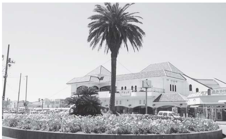
ポピーのある風景