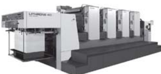
小森社製4色機 (LITHRONE 40)