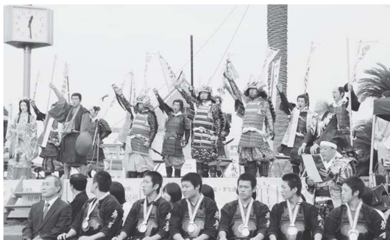
第29回南総里見まつり