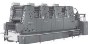
ハイデルベルグ4色機 (MOV)