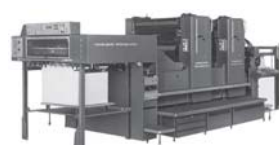
ハイデルベルグ2色両面機 (102ZP)