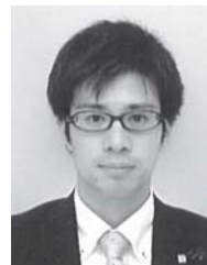
株式会社アークス

館山で働くいろいろな職種の方々にお話を伺い、勉強させていただく思入会しました。これからよろしくお願ひいたします。 焼肉白頭山は館山にて創業昭和39年当初よりこだわりの和牛を仕入れ、その味を守り続けています。是非一度こだわりの味を堪能しに来て下さい。