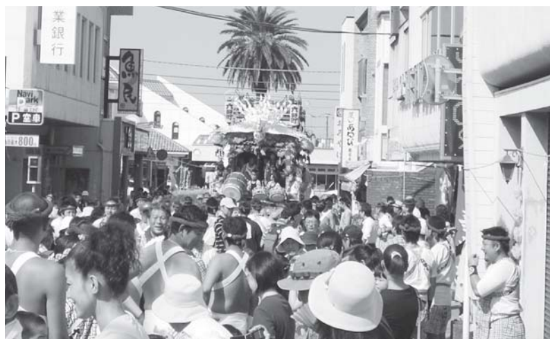
千葉県無形民俗文化財指定『八幡祭り』