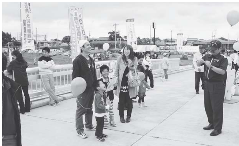
たてやま海まちフェスタ 2010

第94回 通常議員総会 平成21年度の事業報告・決算を承認 決算額は、1億992万円