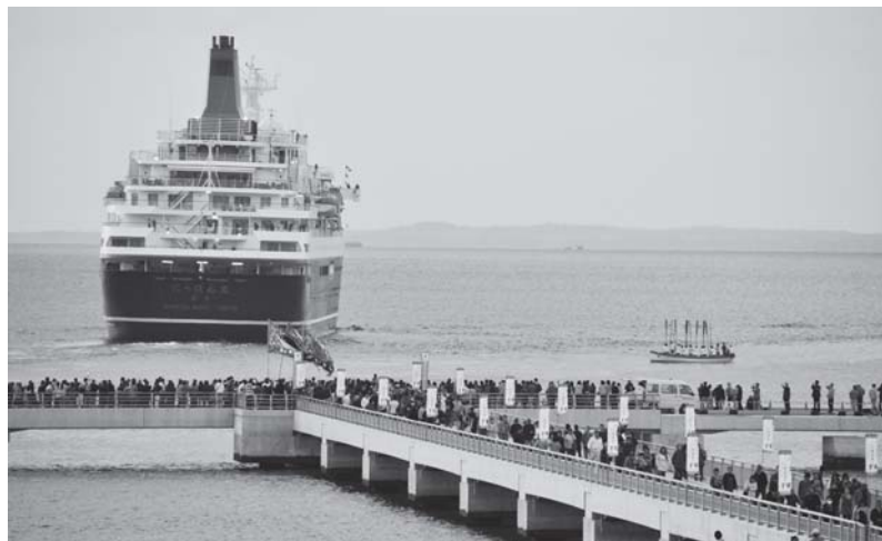
祝 竣工：館山港多目的観光棧橋とにっぽん丸

確実な事業経営に、「マル経資金」をご活用ください！ 利子補給制度もスタートしさらに有利に！