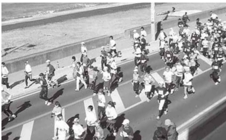
第31回若潮マラソン大会